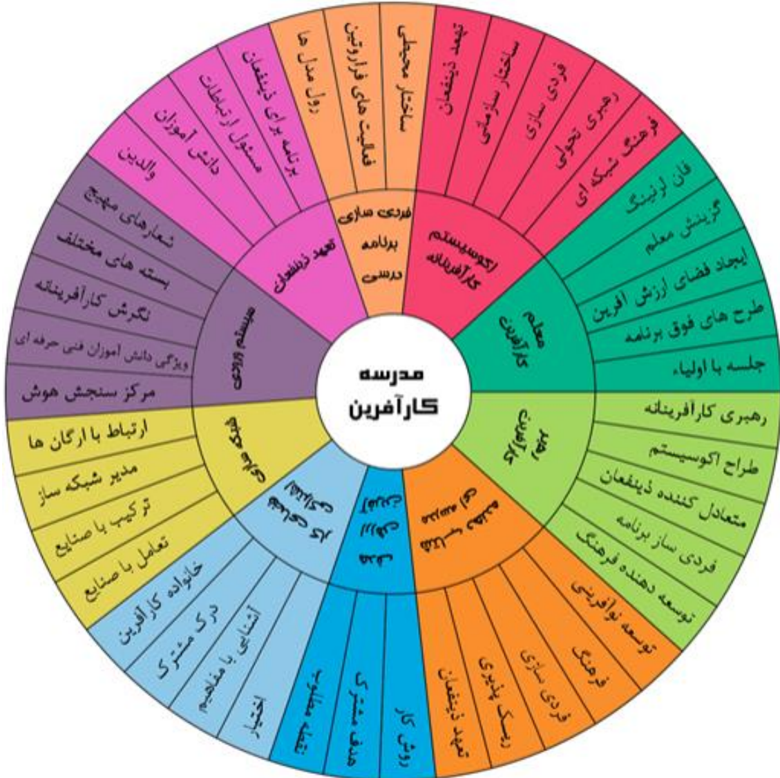
شکل ۲. مدل مدرسه کارآفرین

مؤلفه اول مدرسه کارآفرین با عنوان «استقرار اکوسیستم کارآفرینانه» همسو با پژوهش‌های پیشین ارائه شده است. اکوسیستم مجموعه‌ای از دورنماهای فرهنگی متمرکز، شبکه‌های اجتماعی، حمایت مالی، مؤسسات آموزشی و سیاست‌های اقتصادی فعال است که برای کسب‌وکارهای مخاطره‌آمیز، محیط‌های حمایتی فراهم می‌کند (داوری و همکاران، ۱۳۹۶). یک اکوسیستم کارآفرینی به‌عنوان مجموعه‌ای از بازیگرانی که به هم وابسته‌اند تعریف می‌شوند که به نحوی عمل می‌کنند که کارآفرینی را فعال می‌سازند. این ساختار و فرایند در یک شرایط خاص نهادی و فیزیکی قرار دارد که اداره و اقدام بعدی فرایند کارآفرینی را ممکن یا محدود می‌سازد (حاجی‌آقایی و خلخالی، ۱۳۹۸، استام ۱ ، ۲۰۱۴). این نشان می‌دهد که بدون استقرار یک اکوسیستم کارآفرینانه در مدارس، امکان بسط عملی کارآفرینی وجود ندارد.