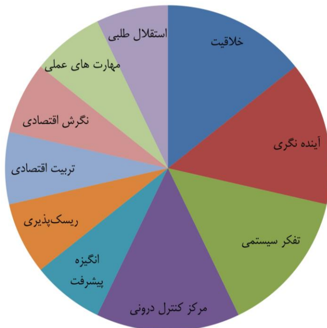
شکل ۱. توجه به مؤلفه‌های کارآفرینی در مطالعات پیشین

پیشینه پژوهش نشان می‌دهد که ویژگی‌ها و مؤلفه‌های کارآفرینانه مورد توجه در کتب و محتوای درسی نظام‌های آموزشی در چندین جنبه مورد توجه قرار گرفته است (شکل ۱).